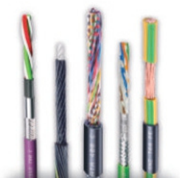
CABOS FLEXÍVEIS CONTÍNUOS