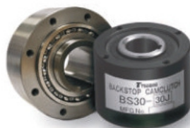
CONTRA-RECUOS E EMBREAGENS DE GIRO LIVRE