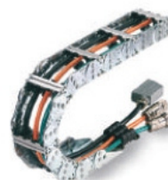
TRANSPORTADORES DE CABO DE AÇO