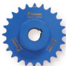
RODAS DENTADAS SMART TOOTH®